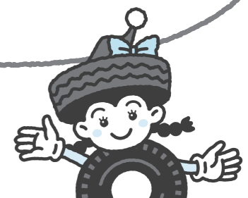
イラスト デザイン教室

公取協だより本誌では、この記事の他に 「低車外音タイヤ」制度(続き) スマホde事前相談 イラストデザイン教室 など様々なコンテンツを取り上げています。 会員の方はご覧になってください。